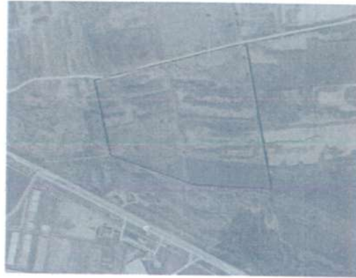
Ilustración 1. Ubicación espacial del predio respecto al POEREO.

1. Que los predios ubicados en la Parcela 5 Z-1 P1/1, Parcela 6 y Parcela 9 Z-1 P1/1, todas del Ejido Viburillas, con claves catastrales 050308966140005, 050308966140006 y 050302201026018, se encuentran, de acuerdo al SIG del modelo del POEREO, sobre las UGA número 175, número 232 y la número 234, denominadas "Esperanza", "Zona Urbana la Griega" y "La Griega" respectivamente.