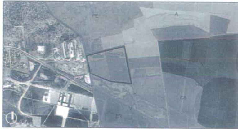
Informe de Uso de Suelo